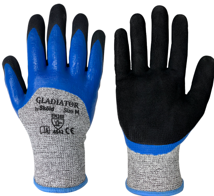
Guante Gladiator Anticorte